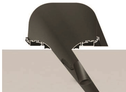
GROOVE 70 mm