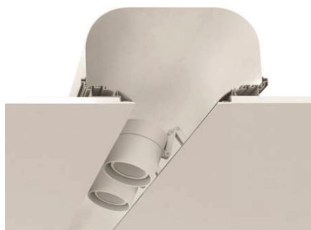
GROOVE 140 mm